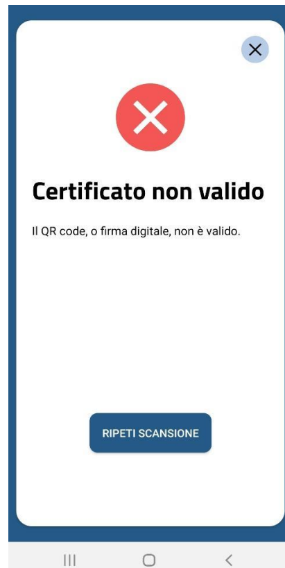
Figura 6 Schermate Verifica C19 - QR code non validato per formato errato o firma non valida