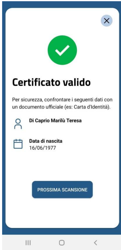
Figura 5 Schermate Verifica C19 - messaggio di conferma per QR code validato correttamente