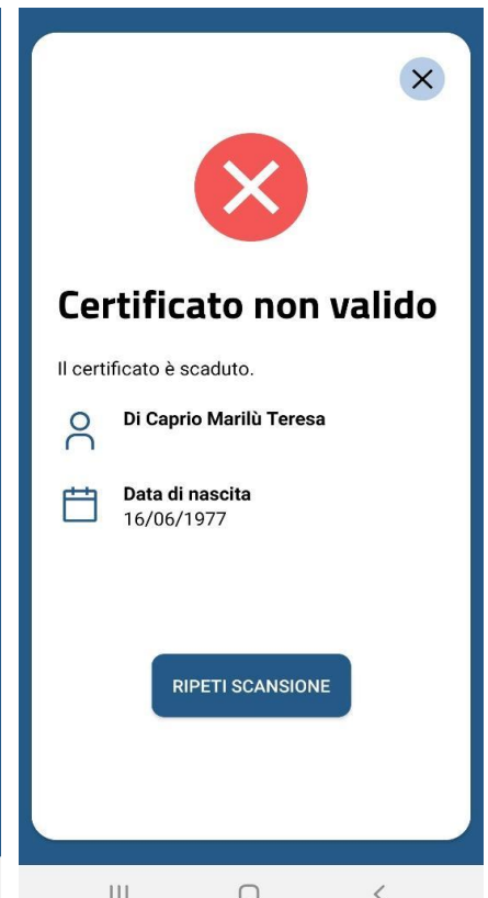
Figura 7 Schermate Verifica C19 - QR code validato correttamente ma scaduto