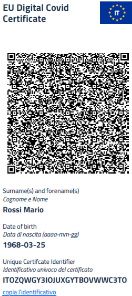
Figura 10 Schermata app IO - visualizzazione certificazione verde COVID-19