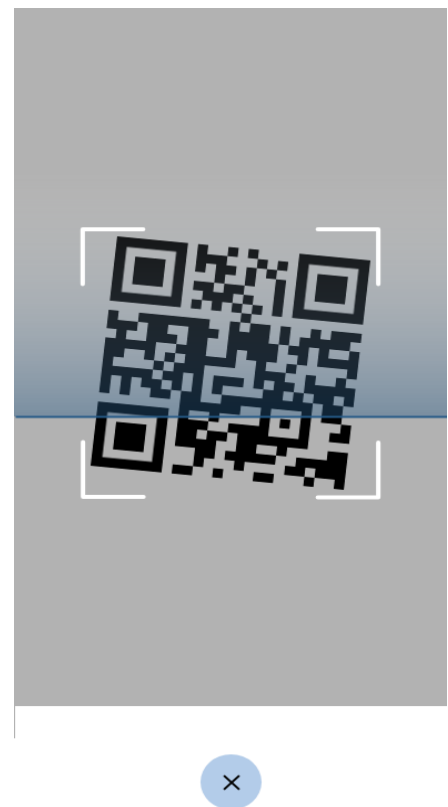
Figura 3 Schermate Verifica C19 - scansione di un QR code