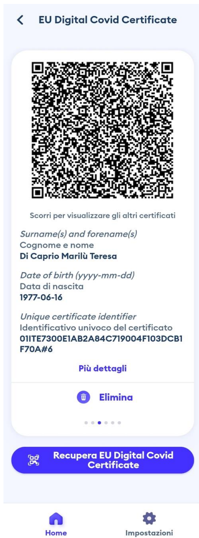
Figura 9 Schermata app Immuni - visualizzazione certificazione verde COVID-19

Nelle figure 9 e 19 viene mostrato come l'utente visualizza la propria certificazione nelle app.